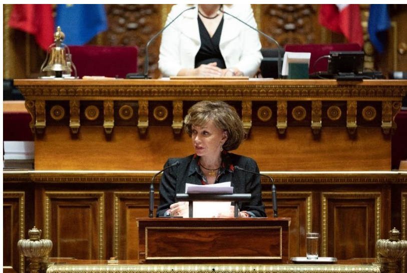
en séance - ©Sénat/Sonia Kerlidou